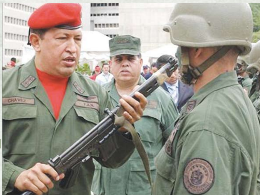
El presidente Chávez impulsa la guerra a través de discursos y actos públicos

(Sábado 26 de enero de 2008. Caracas. Firma de un acuerdo alimentario con su colega nicaragüense Daniel Ortega).