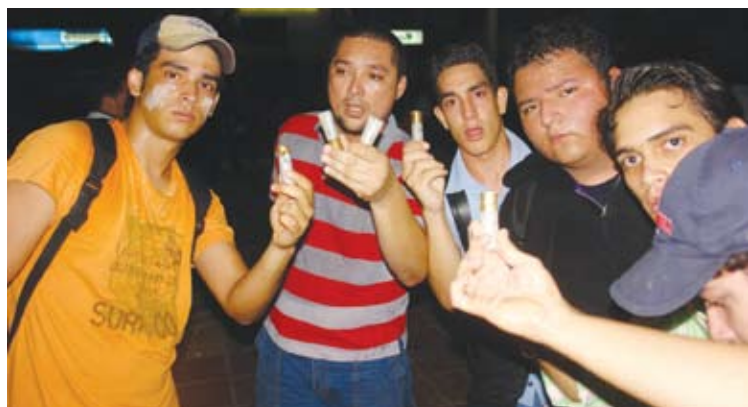
El pasado martes en la noche los estudiantes de la Urbe mostraron a los medios las conchas de perdigones dejadas por la GN.